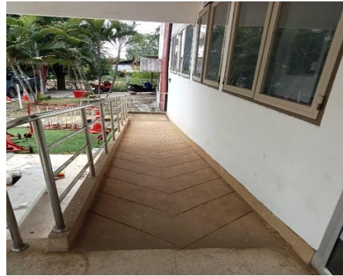
ทางลาดสำหรับผู้พิการ