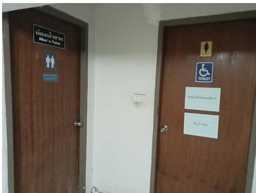
ห้องสุขา แยกชายหญิงทั้งสองฝั่งอาคาร