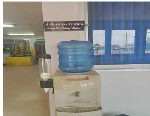
จุดบริการน้ำดื่มสำหรับผู้มาใช้บริการ