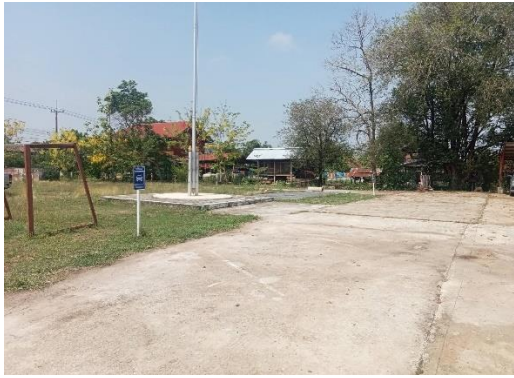
ที่จอดรถสำหรับประชาชนบริเวณด้านหน้า สภ.