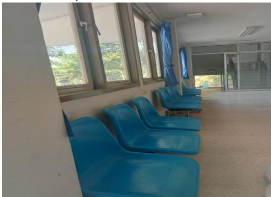
ที่พักนั่งรอสำหรับผู้มาใช้บริการ